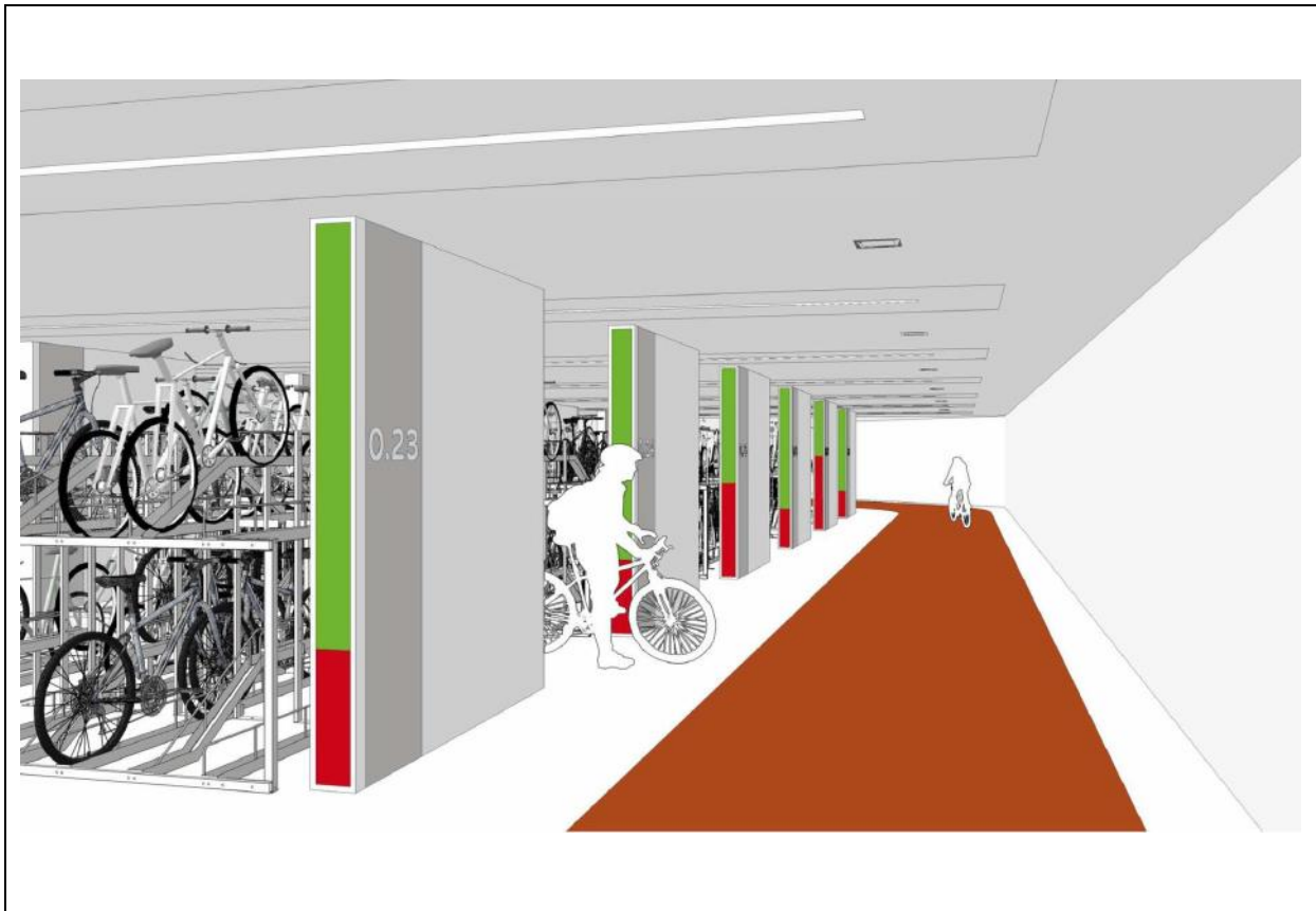
Figuur 2: beeldimpressie fietspad door stalling Oost met dwarspaden/fietsenrekken

Bij elk dwarspad is op een dynamisch display aangegeven hoeveel vrije plaatsen er nog zijn in het gangpad (hier door de architect bedacht als rode en groene led balk).